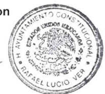
TESORERIA H. AYUNTAMIENTO CONSTITUCIONAL RAFAEL LUCIO, VER. 2018 2021