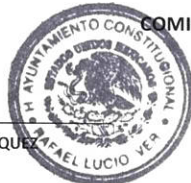
COMISIÓN DE HACIENDA SINDICATURA H. AYUNTAMIENTO CONSTITUCIONAL RAFAEL LUCIO, VER. 2018 2021